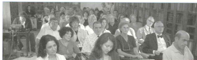
El públic va omplir les aules de les V Jornades Poètiques