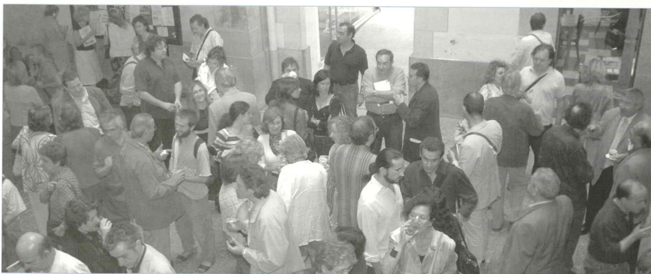
Els assistents van poder gaudir d'un refrigeri el darrer dia de les Jornades Poètiques de l'ACEC a l'Ateneu Barcelonès